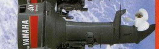
40hp E40IW E40JMH