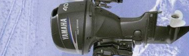
40hp F40BWHHD F40BWHHD