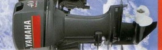
40hp E40XVT E40XW E40XMH