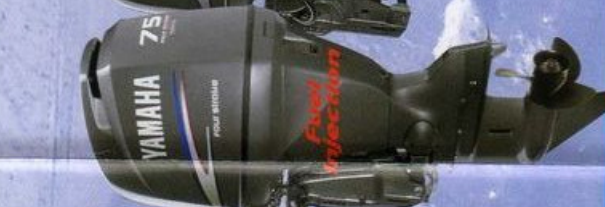
75hp F75CED F75CEHD