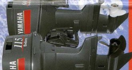
60hp E60HVD E60HMD