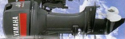
40hp E40XWT E40XW E40XMH