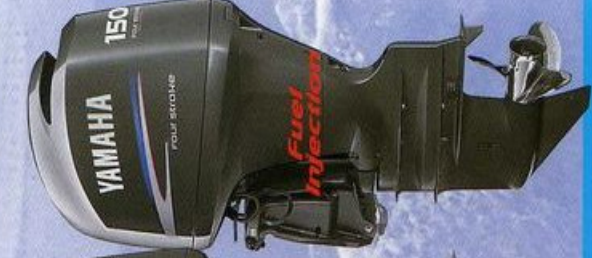
150hp F150AET FL150AET