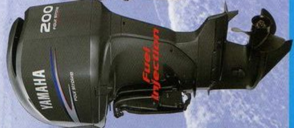
200hp F200BET FL200BET