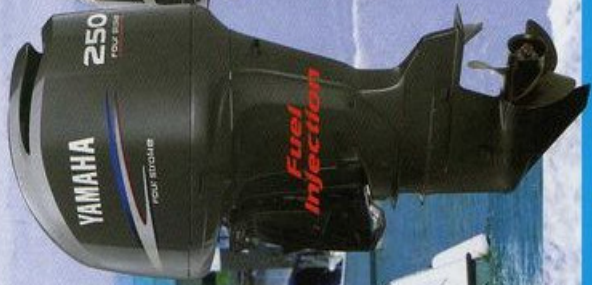
250hp F250AET FL250AET