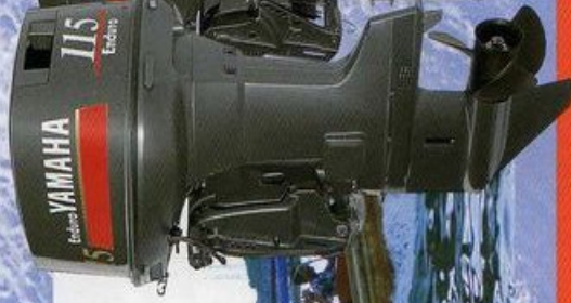
115hp E115AET E115AE