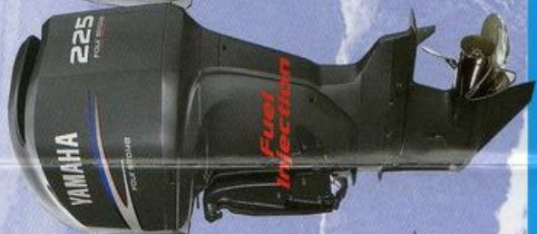
225hp F225AET FL225AET